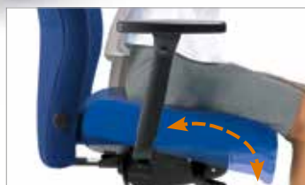
Sitzneigeautomatik. Sitzfläche neigt sich automatisch nach vorne bei Gewichtsverlagerung