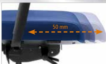
Schiebesitz. Tiefe 50 mm einstellbar

(für Parkett, Stein, Fliesen, etc.) Best.-Nr. 260 219 CHF/VE 29,90